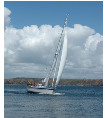
Die HR 48