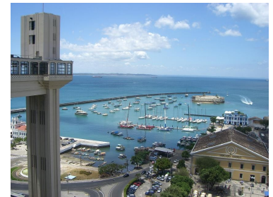
Hafen von Salvador

Iguaçu-Wasserfälle, das Amazonas-Gebiet, Pantanal (traumhafte, unberührte Natur!) oder Ziele in Argentinien, Chile oder Uruguay.