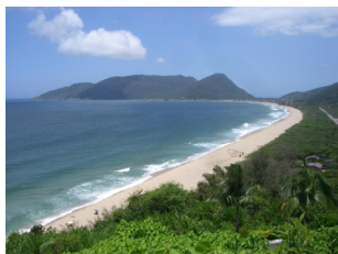
Ilha de Santa Catarina

Florianópolis , die Hauptstadt von Santa Catarina, ist zweifelsohne eine der schönsten Städte Südbrasilien. Sie liegt auf der 412 km 2 großen Ilha de Santa Catarina , die mit ihrer grünen Hügellandschaft und zahlreichen Stränden ein wahres Naturparadies darstellt. Zwei Brücken verbinden sie mit dem Festland. Wer ins Zentrum kommt, muss unbedingt die im Kolonialstil erbaute Markthalle aus dem Jahr 1898 besuchen. Dieser Mercado Público verwandelt sich jeden